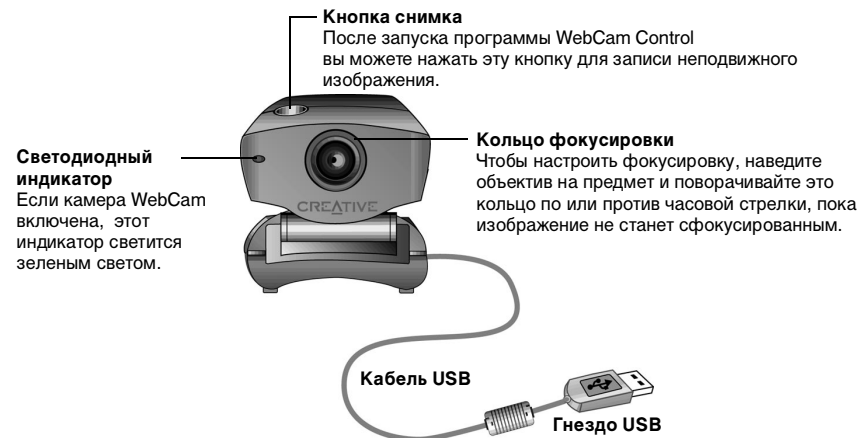
Рисунок 1-1: WebCam Plus.

Рис. 1-1 демонстрирует возможности WebCam Plus.