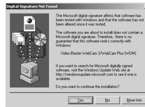
Рисунок 1-4: Диалоговое окно "Цифровая подпись не найдена".